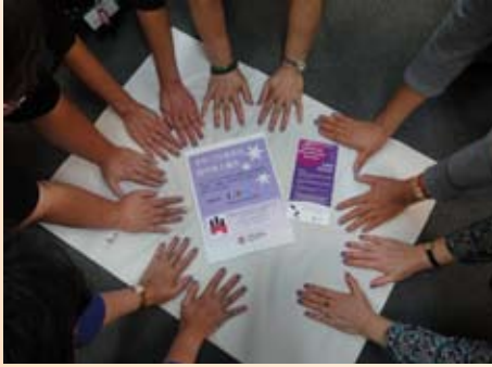
(參加者塗抹指甲油後合照)

今年三月，為提高華人婦女認識可以挽救性命的宮頸檢查，新州癌症學會(Cancer Institute NSW) 特意舉辦了一個名為「為你的指甲塗上紫色」(NOT JUST NAIL POLISH) 的宣傳活動。透過塗上紫色的指甲油，希望為年齡介乎18-69歲的婦女們，帶出須定期做宮頸/柏氏抹片的重要性。本會支持小組的會友亦有響應參與這次有意義的活動，並呼籲華人婦女聯繫家庭醫生，預約作柏氏抹片檢查 (Pap Smear)。