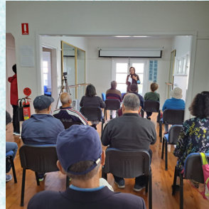
右圖為廣東話小組 →