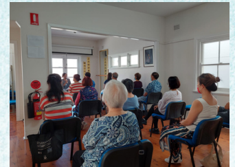
← 左圖為普通話小組

此外，本會在本年七月中已完成了製作「培育正念的好處」正念練習示範的視頻修訂工序，並上載到本會的網頁上以及YouTube中，歡迎大家上網觀賞及跟隨進行練習。